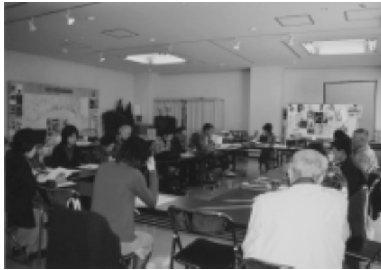
「湘南美術散歩」では、参加者同士の活発な意見交換が行われる