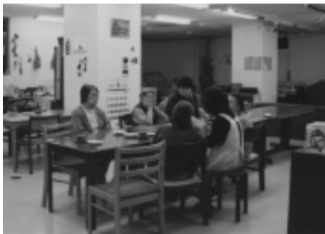
福祉コンビニでのデイサービスの様子(ニュースタート事務局)