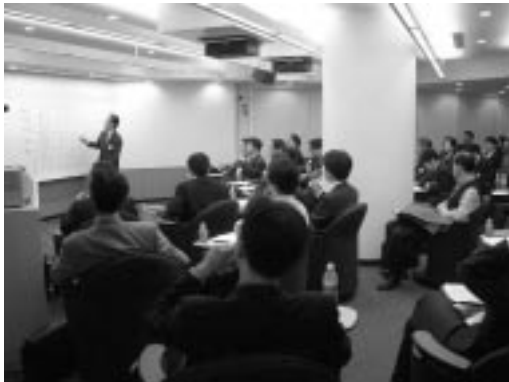
「コミュニケーション&リーダーシップ」高木晴夫KBS教授のレクチャー

丸の内シティキャンパス(MCC) 住所 東京都千代田区丸の内2-6-2 丸の内八重洲ビル6階 電話 03-5220-1311 設立 2001年4月 http://www.keioncc.com 慶應義塾大学と連携した社会人向け教育機関として、2001年4月より株式会社慶應学術事業会が運営。東京・丸の内・メインキャンパスを構え、丸の内再開発を進める三菱地所株式会社と提携し、大学、企業、市民の「交流の場」を目指す。丸の内エリアのビジネスパーソンや首都圏の社会人を対象にした先進的なプログラムを開発・展開している。