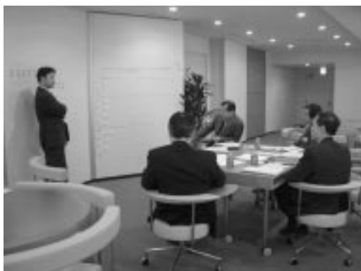
事例を用いた模擬交渉「ビジネスプロフェッショナルのための交渉学」

スタートして一年半あまりだが、ビジネスパーソンの「知」の拠点として定着しつつある、丸の内シティキャンパス(以下、MCC)。ここではそのコンセプトやプログラムなど、これまでの取り組みを紹介する。