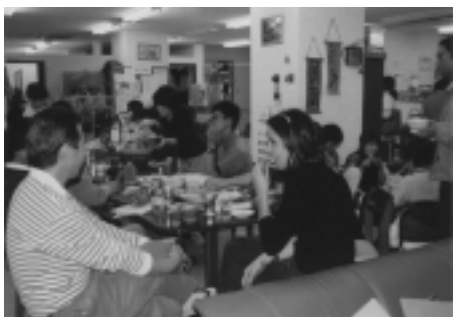
週に1度の鍋会。ここで働くスタッフの家族もたまに顔を出す(同上)